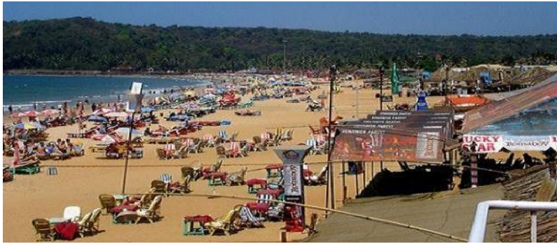
Diner au restaurant en bord de mer.